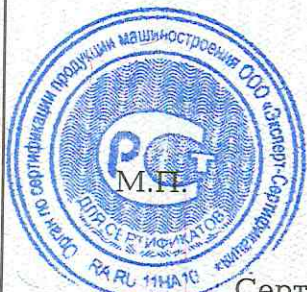
Схема сертификации: 2.